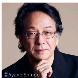
指揮 沼尻竜典 (神奈川フィル音楽監督)