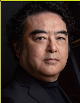
ピアノ 清水和音 SHIMIZU Kazune, Piano