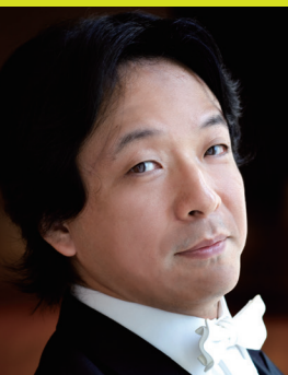
指揮 沼尻竜典 [神奈川フィル音楽監督] NUMAJIRI Ryusuke, Conductor