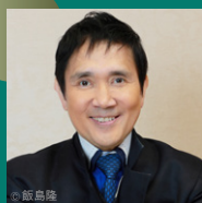
指揮 大植英次 Conductor EIJI OUE

神奈川フィルの2024年シーズン2回目のみなとみらいシリーズは、神奈川フィルをリードするコンサートマスター大江 馨のヴァイオリンソロ、そして欧米で活躍を続けながら、近年では再び日本でも輝く大植英次の登壇。随所に立夏を感じるエドゥアール・ラロ作曲によるスペイン交響曲、20世紀のシンフォニーとして絶大な人気を誇るセルゲイ・ラフマニノフの交響曲第2番。毎年神奈川フィルとの名演を重ねるベテラン大植英次が振る、強コントラストの2曲に乞うご期待。