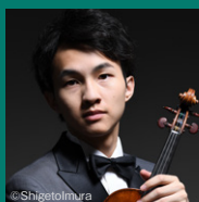
ヴァイオリン 大江 馨 (神奈川フィルコンサートマスター) Violin KAORU OE

桐朋学園で齋藤秀雄に師事。タングルウッド音楽祭でレナード・バーンスタインと出会い、世界各地の公演に同行、助手を務めた。エリー・フィル音楽監督、ミネソタ管音楽監督、ハノーファー北ドイツ放送フィル首席指揮者、パルセロナ響音楽監督、大阪フィル音楽監督を歴任。05年『トリストランとイゾルテ』で日本人指揮者として初めてバイロイト音楽祭に出演。2009年ニーダーザクセン州功労勲章・一等功労十字章受章。現在、大阪フィルハーモニー交響楽団桂冠指揮者、ハノーファー北ドイツ放送フィルハーモニー名誉指揮者。ハノーファー音楽大学終身正教授。