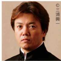
指揮 現田茂夫 (神奈川フィル名誉指揮者) Shigeo Genda, Conductor

コンテンポラリーダンサー森下真樹が6人で全楽章を踊る、フルオーケストラと共演する究極の第九！さらに合唱とソロも担当する神奈川ハーモニック・クワイアは、前面でダンスとの共演で歌う。現代に進化した第九初演から200年の特別企画である。