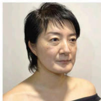
振付 森下真樹 Maki Morishita