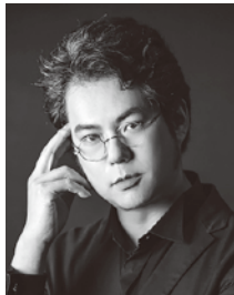
バリトン 大沼 徹 Toru ONUMA