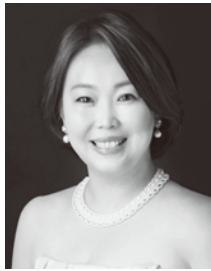
ソプラノ 隠岐 彩夏 Ayaka OKI