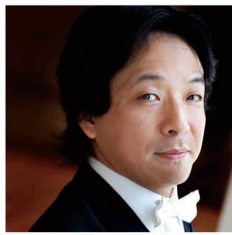
指揮 沼尻竜典 (神奈川フィル音楽監督) Ryusuke Numajiri, Conductor