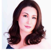
サロメ 田崎尚美 Naomi Tasaki, Salome

2022年4月より神奈川フィルの音楽監督に就任。これまで国内外数々のポストを歴任。ドイツではリユーベック歌劇場音楽総監督を務め、オペラ公演、リユーベック・フィルとのコンサートの双方において多くの名演を残した。ベルリン、ロンドン、パリ、モントリオール、シドニー等世界各国のオーケストラ、ケルン、ミュンヘン、ベルリン、バーゼル、シドニー等の歌劇場へも客演を重ねている。芸術監督を務めたびわ湖ホールでは、ミヒャエル・ハンペの新演出による《ニーベルングの指環》を上演、空前の成功を収めた。14年には横浜みなとみらいホールで委嘱でオペラ《竹取物語》を作曲・初演、国内外で再演されている。17年紫綬褒章受章。