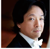
指揮 沼尻竜典 (音楽監督) Rysuke Numajiri, Conductor

2022年4月より神奈川フィルの音楽監督に就任。これまで国内外数々のポストを歴任。ドイツではリユーベック歌劇場音楽総監督を務め、オペラ公演、リユーベック・フィルとのコンサートの双方において多くの名演を残した。ベルリン、ロンドン、パリ、モントリオール、シドニー等世界各国のオーケストラ、ケルン、ミュンヘン、ベルリン、バーゼル、シドニー等の歌劇場へも客演を重ねている。芸術監督を務めたびわ湖ホールでは、ミヒャエル・ハンペの新演出による《ニーベルングの指環》を上演、空前の成功を収めた。14年には横浜みなとみらいホールで委嘱でオペラ《竹取物語》を作曲・初演、国内外で再演されている。17年紫綬褒章受章。