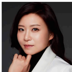
指揮 シーヨン・ソン Shi-Yeon Sung, Conductor

プライス、コルンゴルトの作品と聴く“新世界より”がどのように響くのか新たな楽しみを発見してみるのはいかがだろう。