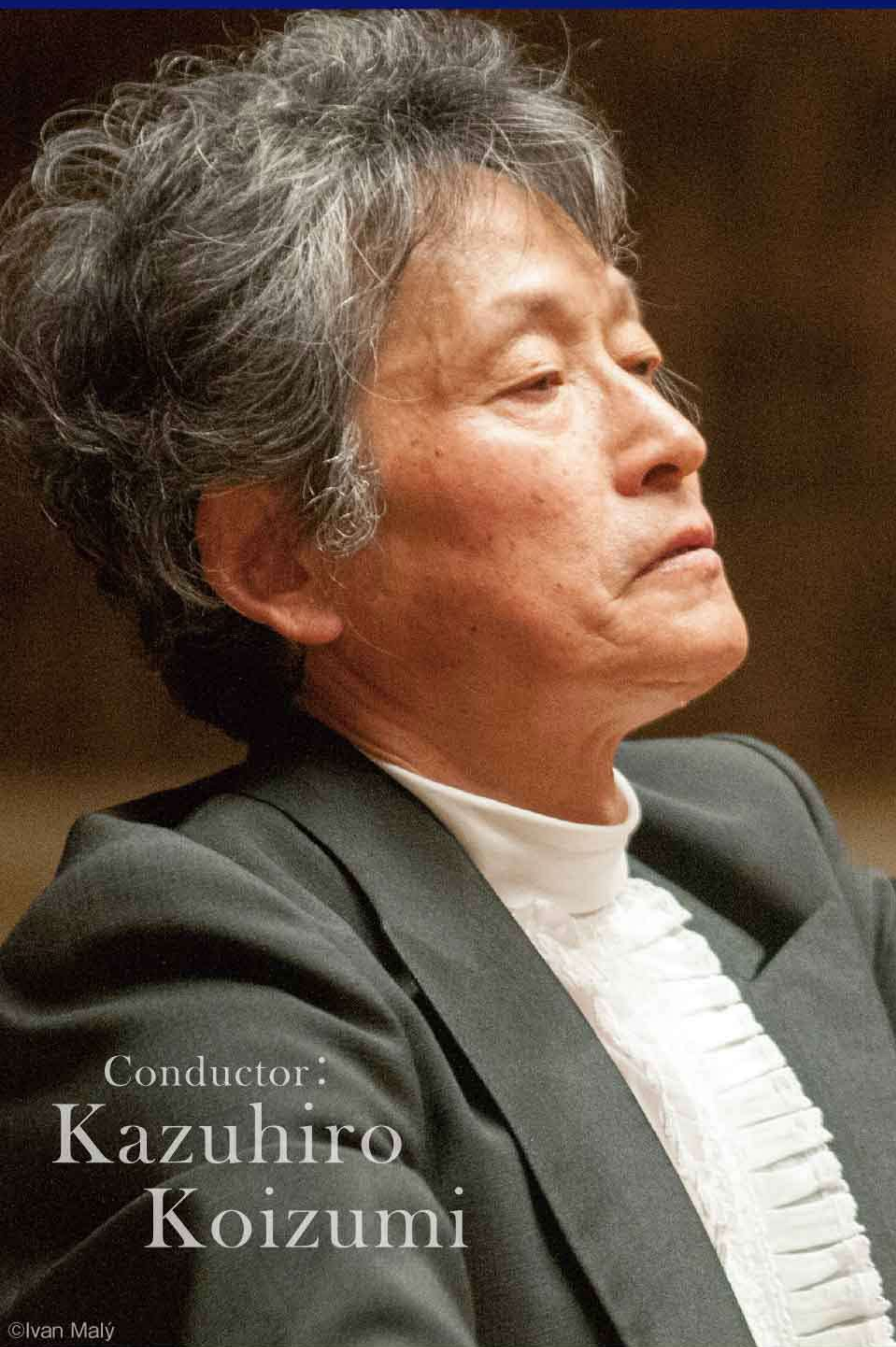
Conductor: Kazuhiro Koizumi

Conductor: Kazuhiro Koizumi (Special Guest Conductor)